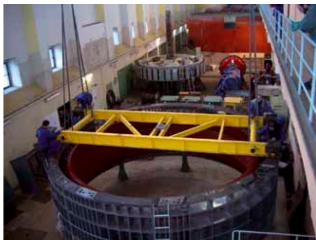
Vodní elektrárna Štěchovice

Významnou zakázkou společnosti 1.SERVIS-ENERGO, s.r.o. je v současné době výměna vinutí a oprava generátoru přečerpávací vodní elektrárny Dalešice pro ČEZ, a.s.. Dalšími významnými zakázkami jsou v letošním roce realizované opravy na elektrárnách vltavské kaskády Kamýk, Vrané a Or-