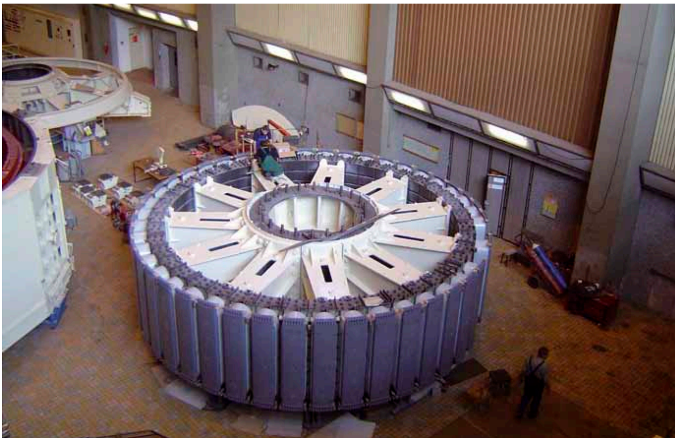
Vodní elektrárna Dalešice

1.SERVIS-ENERGO, s.r.o. postupně upustila od veškerých vedlejších výrobních aktivit a vyprofilovala se na trhu jako „specializovaná montážní, opravárenská a servisní firma pro oblast generátorů“. Tento trend hodlá udržet a nadále rozvíjet úzkou specializací a zkvalitňování služeb.